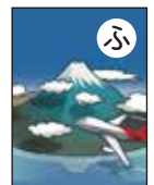
ふちまで 図柄あり

不明点、質問等ございましたらお気軽にお問合せください。 TEL 055-235-6010