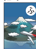
ふちまで 図柄あり

不明点、質問等ございましたらお気軽にお問合せください。 TEL 055-235-6010